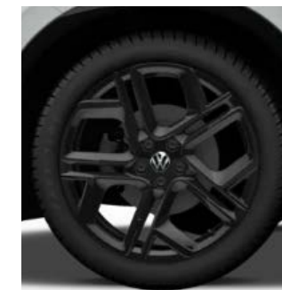
York in zwart