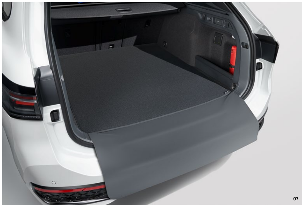
07 Volkswagen dubbelzijdig kofferbakmat met laadprotectie - Met laadbescherming achterbumper - Velours/kunststof Art.nr. 3J0061210