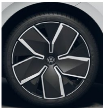
Leeds in zwart