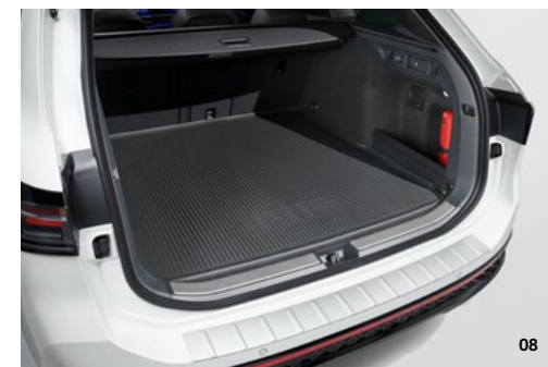
08 Volkswagen kofferbaklinleg Art.nr. 3J0061160 09 Laadkabel 'HELICES' mode 3 (voor wallbox of publiek laden) - De oplaadkabel die geschikt is voor reis en thuisgebruik - Laadkabel type 2, 3 fase 20 ampère per fase, 11kWh - Gemaakt van vormgeheugenlegering - Laadkabel neemt zijn oorspronkelijke (opgerolde) vorm aan na het laden - Lengte 5 meter Art.nr. 000054412BM