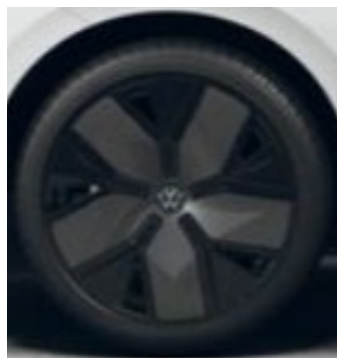
Leeds in mat zwart