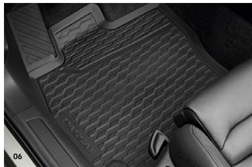
06 Volkswagen rubberen all-weather mattenset - Set 4 stuks Art.nr. 3J1061500 82V