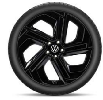
Skagen in zwart