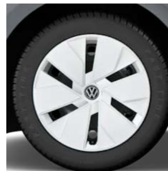
Stalen velg met wioldopp