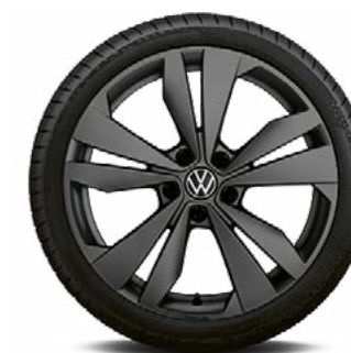
Bergen in zwart